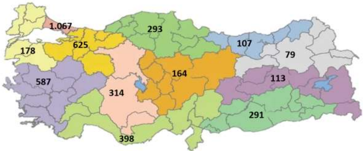
řekil 1: İBBS-1'e Gre Yeni COVID-19 Hasta Sayısı, Trkiye